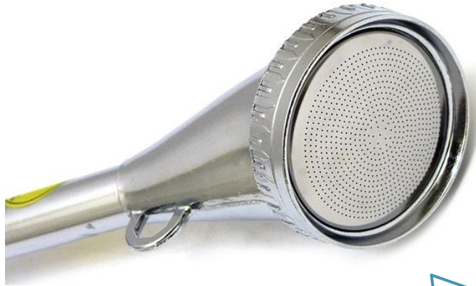
例 プロノズル 品番：PL-7

一部のノズルを除き、リングを取り外してメッシュの目詰まり等をお掃除することができます。